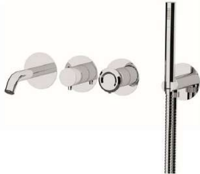
IMMAGINE - IMAGE