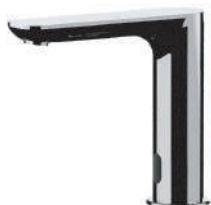
IMMAGINE - IMAGE